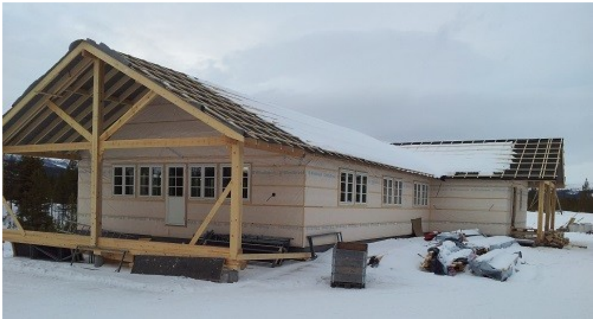
Bilde: Bygging av Servicebygg i Stormoegga vinteren 2013/14